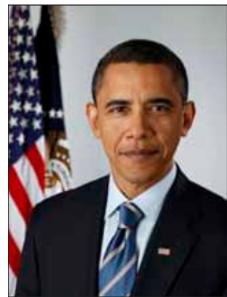
Official portrait of President-elect Barack Obama on Jan. 13, 2009.